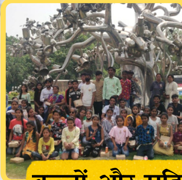
बच्चों और महिलाओं को कराया भारत दर्शन पार्क का भ्रमण