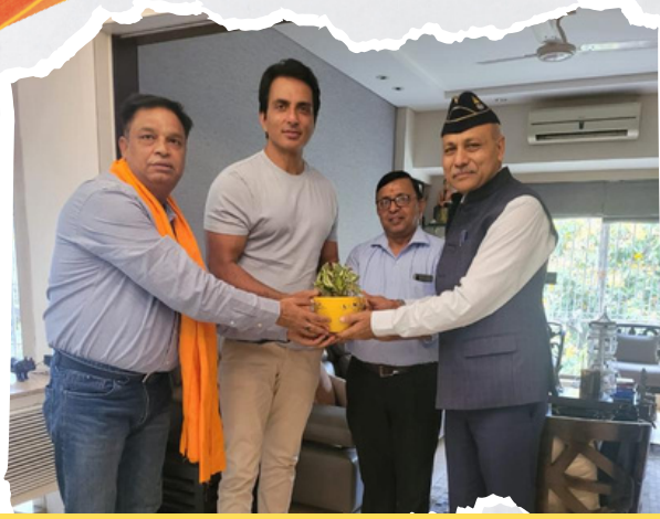
सोनू सूद से मिलने का मिला अवसर