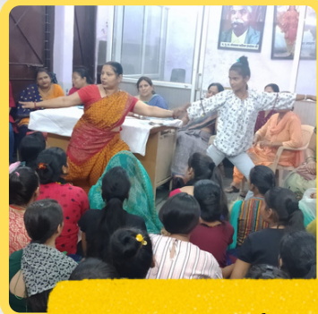
लगी किशोरी विकास शाखा